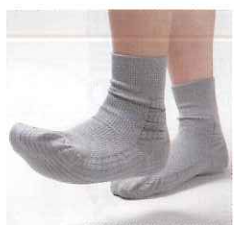
福祉機器コンテスト2007で優秀賞を受賞した「転倒予防くつ下」*