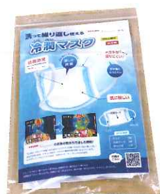
6月には夏場の暑さに対応すべく、涼しさを保てる「冷潤マスク」を発売した